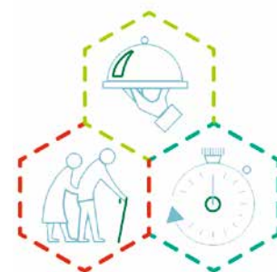
Illustratie: Jeroen Gommers

piramide om, en beginnen met het nemen van sportsupplementen. Ze denken dat die noodzakelijk zijn. De Sportvoedingspiramide helpt sportdiëtisten hun cliënten uit te leggen waarom en welke basisvoeding belangrijk is voor het behalen van goede sportprestaties. Het begint allemaal bij een goede basisvoeding en voor heel veel sporters is dat genoeg.' JV